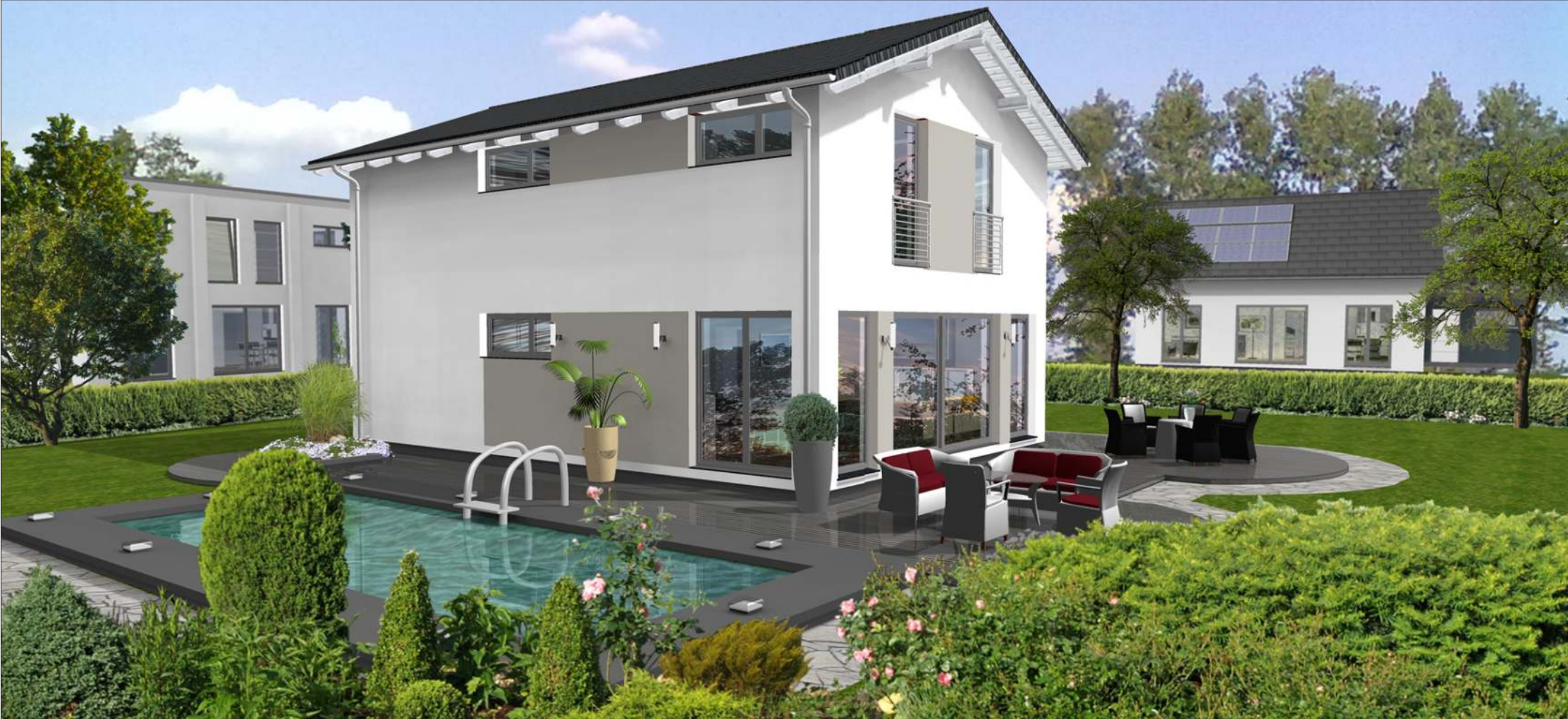
Die Abbildung enthält Sonderausstattungen* der Preis bezieht sich auf die aktuelle BLB * Malerarbeiten und Bodenbeläge in Eigenleistung